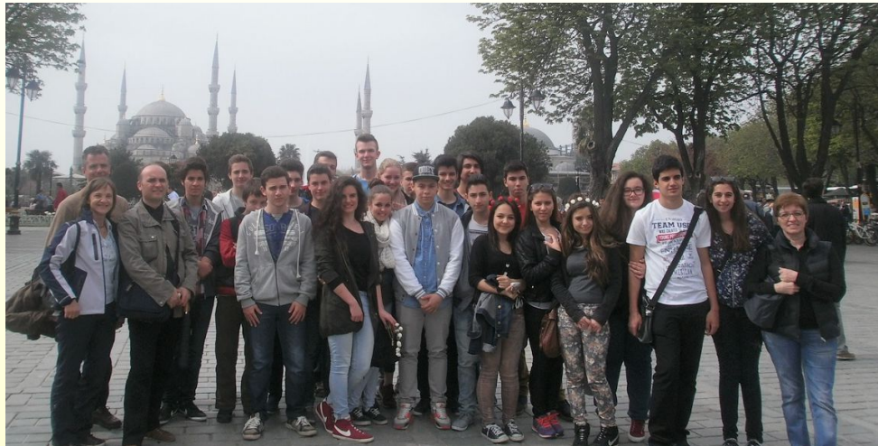
Schüleraustausch mit Tekirdag